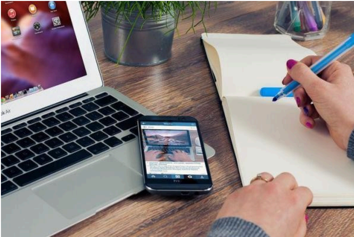
Yrityksen toiminnan seuranta