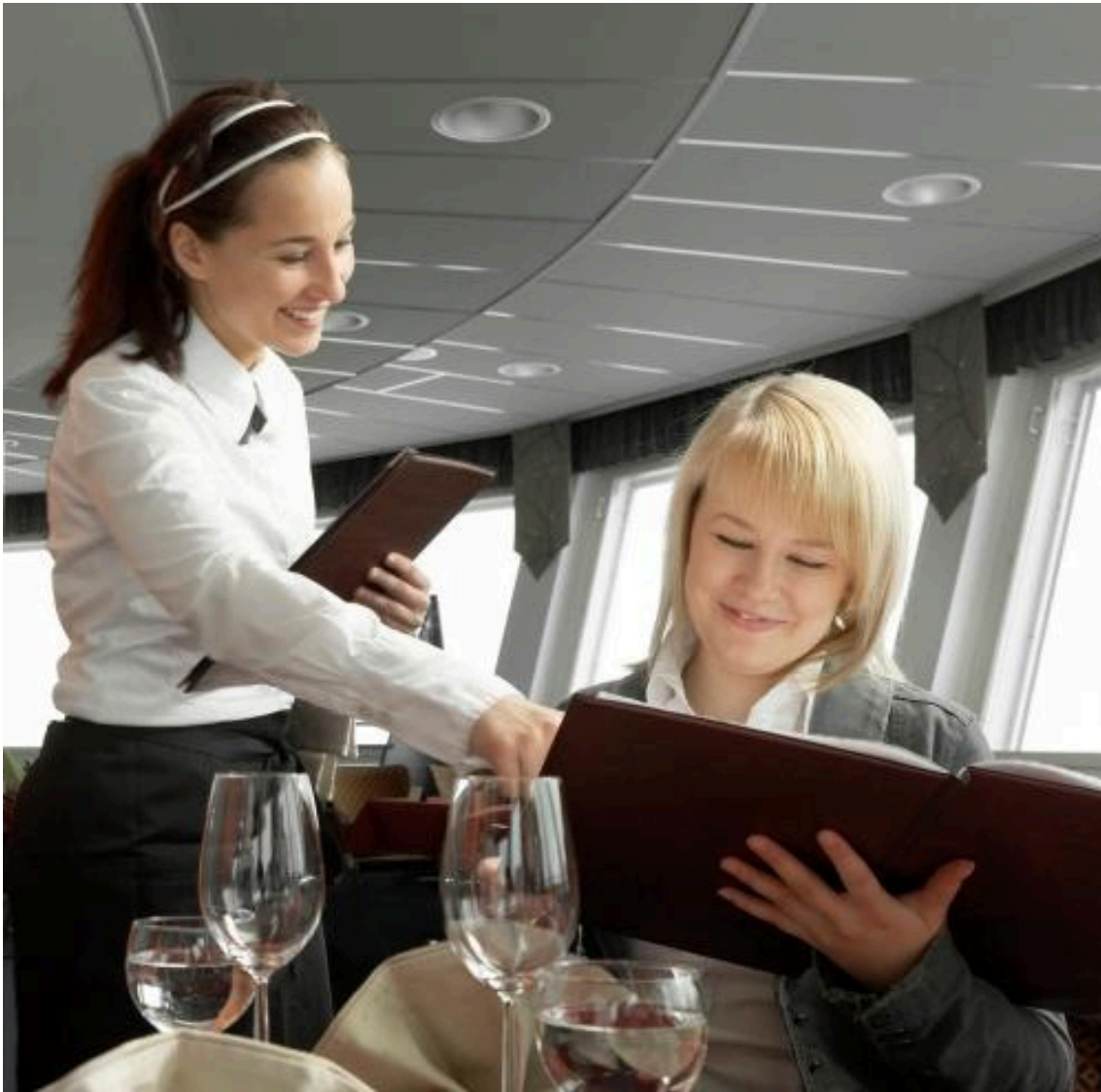
Ravintolan asiakaspalvelu ja myynti