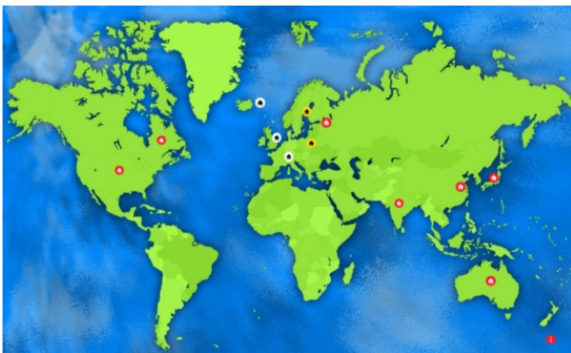
Kansainvälisyys: mahdollisuutena koko maailma

Tämän tutkinnon osan tavoitteena on kansainvälisyysosaamisen hankkiminen esim. kansainvälisessä toimintaympäristössä tai toimien kansainvälisissä projekteissa ja verkostoissa.